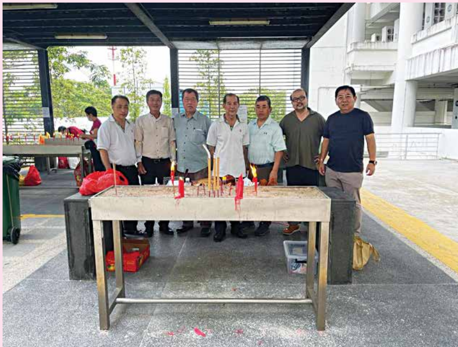
董事们大清早前往万礼骨灰塔拜祭。

锦忠宗长接着操刀切割三牲，分配食物给宗亲，随后大家共进午餐，闲话家常，场面温馨。