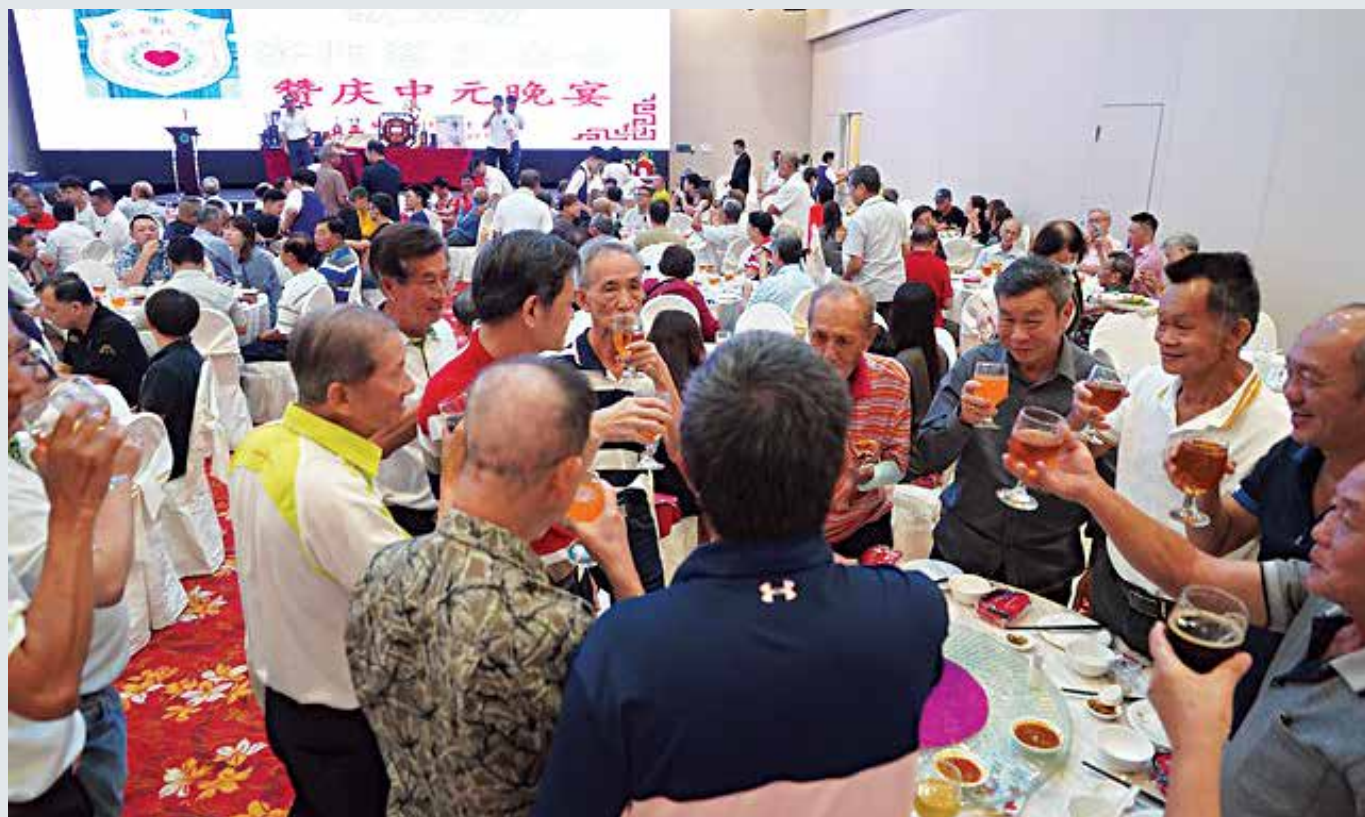
会长义山BBM宗长(左一穿黄领白衫)在中元会晚宴上，举杯与宗亲共同祝贺。

祭拜活动当天，筹备小组早上7点多到达会所，接着三牲祭品送到，筹备小组仔细摆设祭品和福物。上午9时过后，宗亲们陆续抵达。10时，主持仪式的道长与助手准备就绪，以义山BBM会长为首的团队，依照道长的指示，诚心祭拜。道长高声诵经，配合