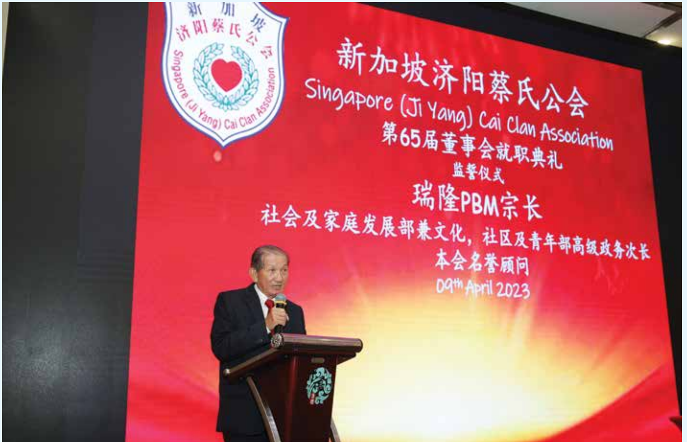
会长义山BBM宗长致词时表示对培养接班人有信心，因为第65届董事会有不少年轻有为的董事。