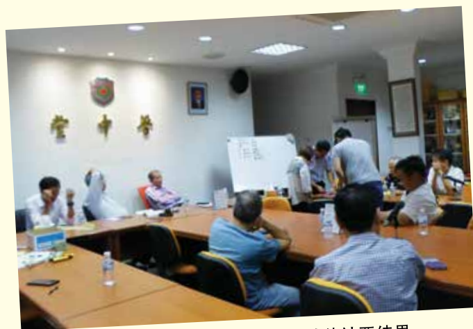
会员大会之后的董事复选，大家专心等待计票结果。