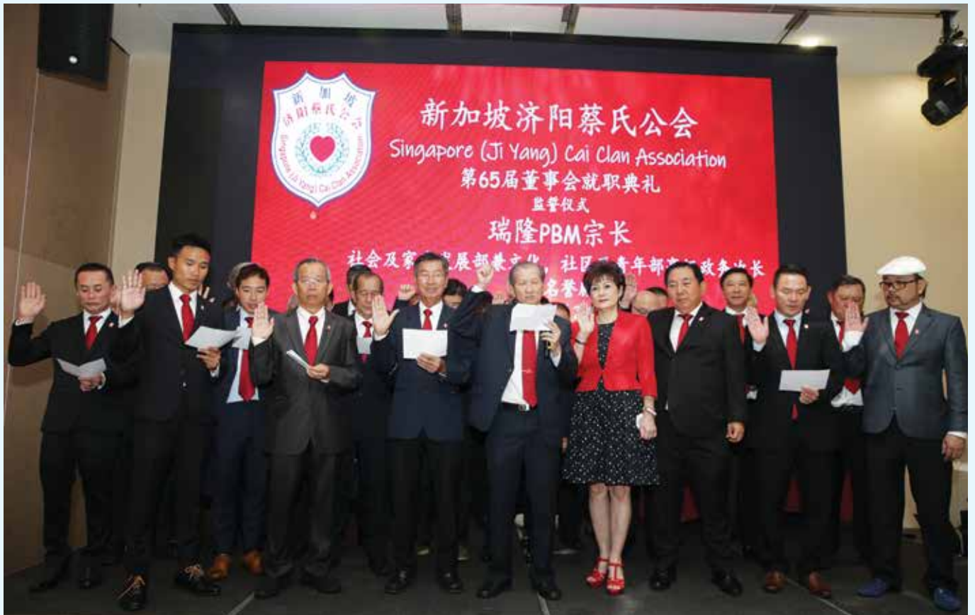
第65届董事在就职典礼上，宣誓为我会效劳。