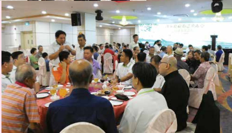
三年后复办春祭晚宴，宗亲们热烈交流，似有谈不完的话题。