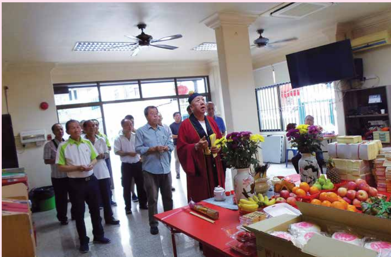
健龄PBM宗长（浅蓝衣者）率领大家参与春祭拜仪式。