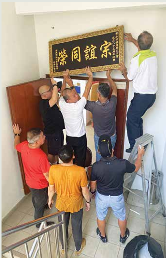
小心翼翼联手移除牌匾，像呵护宗亲之谊。