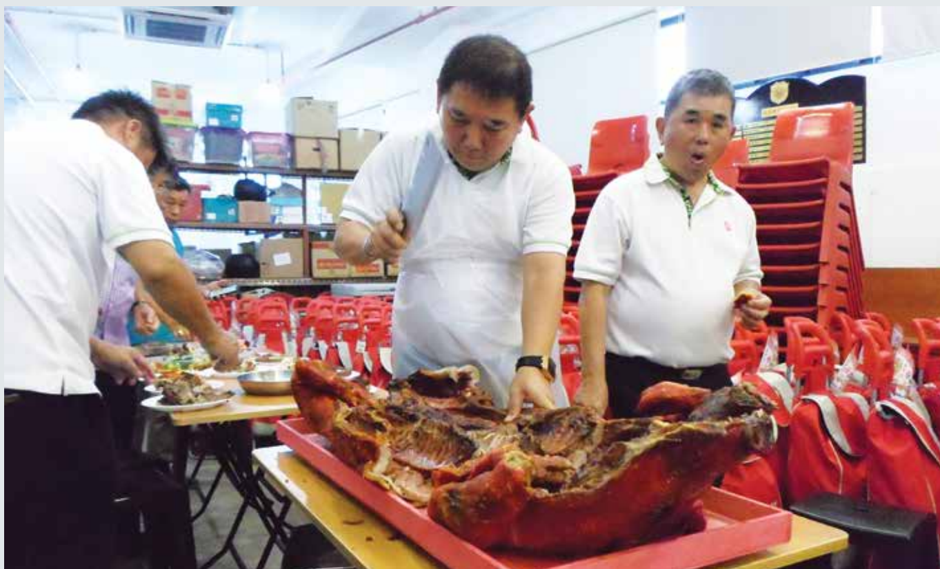
祭拜仪式后，总务锦忠宗长大显身手，准备将烧猪分给宗亲。