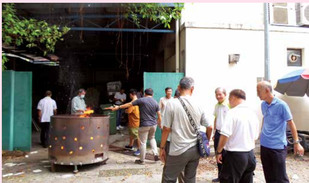
祭拜仪式结束后，大家到会所后院焚烧冥纸。