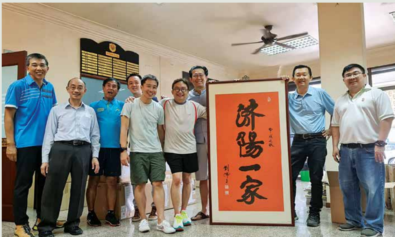
董事们同心协力，将“济阳一家”的大型牌匾拿下，准备载送到临时会所。

搬迁工作从2023年5月初开始，6月下旬完成。扩建工程从9月中开始，预计需时18个月完成。